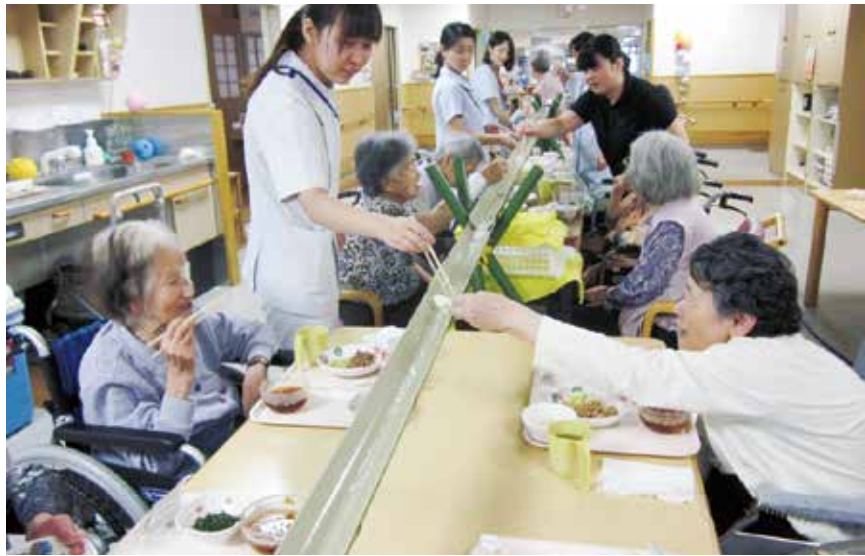
楽しそうに流しそうめんに挑む利用者さんたち

リハビリ南東北福島通所リハビリ恒例の納涼祭が8月12日(土)に施設内で開かれ、利用者さんらが歌やゲーム、流しそうめんなどを楽しみました。今年にはブロック倒し、団扇作り、カラオケ、かき氷、そうめん試食の5コーナーを設けたほか抽選会も行いました。祭りの雰囲気作りとして職員