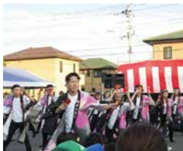
迫力ある職員たちのよさこい演舞