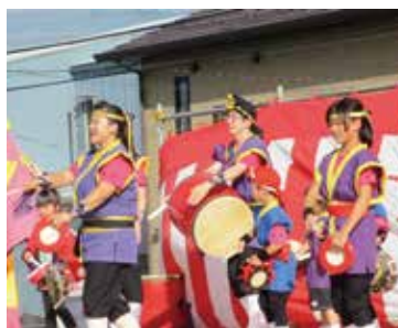
初登場のあづま勇舞伝心のエイサー