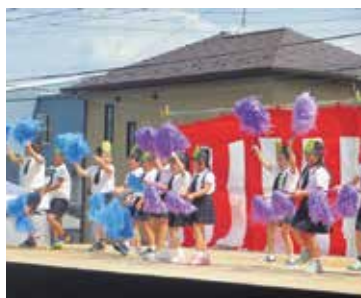
かわいらしい園児たちの遊戯

ステージでは、J A ジャヤデ イスクラブや吉倉八幡太鼓、大正琴研究会、リアアフランスクール、につこりクラブ、愛隣幼稚園、それに今年初参加の沖繩創作エイサーあづま勇舞伝心チームなど7団体が見事な演舞を披露。病院職員たちの「よさこい」も登場して住民たちから盛んな拍手が送られていました。