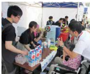
大モテだったかき氷コーナー