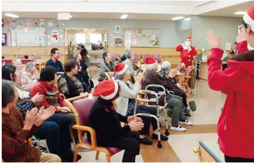
赤い帽子をかぶりクリスマスを楽しむ利用者さんたち

リハビリ南東北福島恒例のクリスマス会が昨年12月25日(月)午後2時から各フロアで開かれ、クリスマス小話や連想ゲーム、音楽で利用者さんたちを楽しませました。