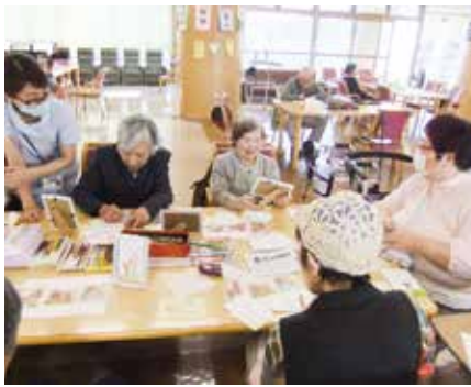
ポストカード作りを楽しむ利用者さん

3月15日(木)午後、リハビリ南東北福島4階フロアでポストカード作りを行いました。「Beleりぼん」のボランティアを講師に迎え、女性を中心に8人の利用者さん