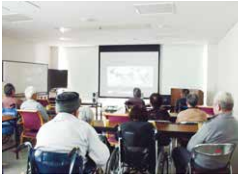
大きなスクリーンで映画を楽しむ利用者さん

劇、長編、短編とさまざま、寅さんでおなじみの「男はつらいよ」もありました。喜劇映画に爆笑する方もおり、上映後には、「映画館みたいで楽しかった」、「次回も楽しみ」