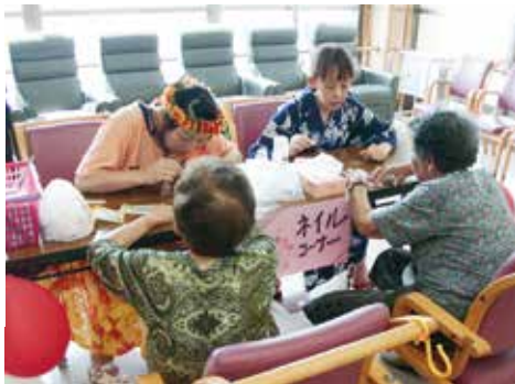
女性の人気を集めたネイルコーナー

食べ物の屋台では、自分で好きな具材をトッピングする手作りクレープが人気でした。あんこやバナナ、生クリームやチョコレシートなどたくさんつけて食べる方もいました。 今年の夏は、例年より暑い毎日でしたが、職員と一緒に過ごせた利用者さんの笑顔をたくさん見ることができました。