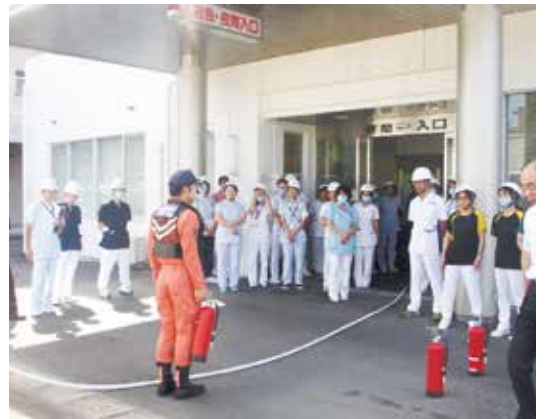
消防署員から消火器の取り扱いについて指導を受ける職員ら

す。地震発生に伴い火災が発生したことを想定し、震災時の初期対応、火災発生時の消火・避難・誘導等の行動が速やかにできるようにするとともに、職員の防災意識の高揚を図るのが狙いです。今回の訓練には、南東北福島病院とリハビリ南東北福島島の2施設から医師、看護師、薬剤師、臨床工学士、事務員、リハビリ職員、警備員、介護福祉士、栄養士ら約40人が参加しました。