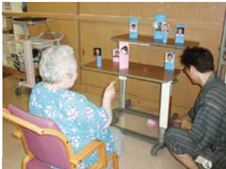
昔の縁日を思い出させた射的コーナー

リハビリ南東北福島では7月21日(土)、4階フロアで「納涼会」を開催しました。午前には主に介護予防通所リハビリの利用者さん、午後からは入所者の皆さんが参加しました。会場にはから揚げやフライドポテト、かき氷などの食べ物が並ぶ屋台、射的コーナー、カラオケなどが用意されました。 フロアの中には和太鼓が設置され、盆踊りを行いました。浴衣姿の女性職員が調子