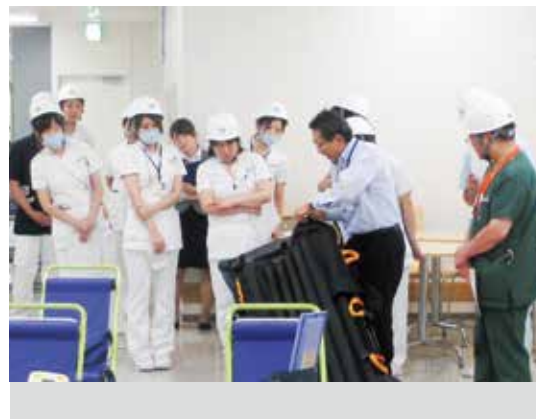
避難補助具の使用方法について説明を受ける職員ら