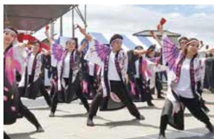
そろいの衣装で息の合った演舞を披露する南東北福島チーム

発表し、①表現力②団結力③躍動感をポイントに審査が行われました。各チームとも日頃の練習の成果を發揮し、息を合わせて華やかな踊りを披露しました。 南東北福島チームは42人の職員が参加しました。出場チームの中で最多人数のパフォーマンスとなりました。披露したのは「南中ソーラン」で、学校教育でも取り入れられているなじみのある曲目です。