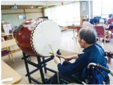
バチを握り元気に太鼓をたたく利用者さん

よく太鼓をたたくと、参加した人たちは太鼓のまわりに集まり踊り始めました。「しばらくぶりに踊ったよ」「歌を聞くと踊らずにはいられないね」などと話し、額に汗を光らせ笑顔で踊っていました。 射的コーナーでは、割り箸を組み合わせて輪ゴムで止めオリジナルの鉄砲を作るところから始まりました。細かい作業で、難しさもありましたが、昔を思い出し熱心に作っていました。