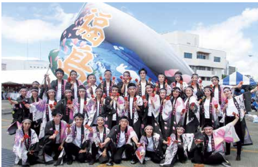
特別賞を受け、大漁旗を背に記念写真に収まる南東北福島チーム

今年で9回目を迎えた南東北グループの「よさこいソーラン大競演会」が8月11日(土)、郡山市の総合南東北病院駐車場で開催され、南東北福島チームは初の特別賞を受けました。