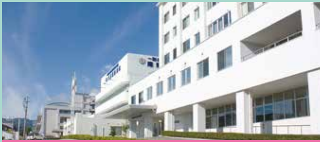
【院是】すべては患者さん・利用者さんのために