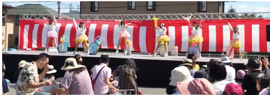
アイドルグループの華やかなステージ

南東北福島病院では9月7日(出)、「秋まつり」を開催しました。近年、夏の暑さが一瞬と激しさを増してきたことから、従来の「夏まつり」を今年度から「秋まつり」と名称を変更、時期をずらしての開催となりました。当日はすばらしい天気とな