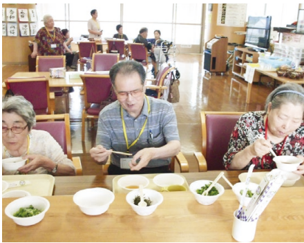
スタッフと一緒にそうめんを食べる利用者さん

予防介護通所リハビリでは8月24日(土)、「納涼祭」を開催しました。昔の遊びやゲーム、ネイルサロン、カラオケ、そうめん食べ放題などを繰り広げました。