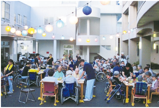
利用者さんに大好評だったビアガーデン

施設の玄関前に会場を作り、夏空の下でビールやソフトドリンクなどを飲んだり、おいなりさん、焼きそば、天ぷらなど、いつもより豪華な料理を食べたりして大いに盛り上がりました。焼きそばや天ぷらはその場で作って提供したので、ライブ感があり利用者の皆さんに大変好評でした。