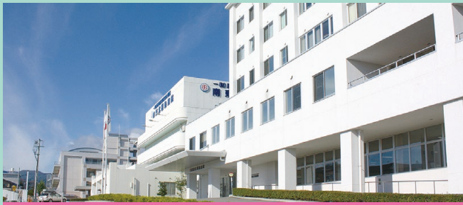
【院是】すべては患者さん・利用者さんのために