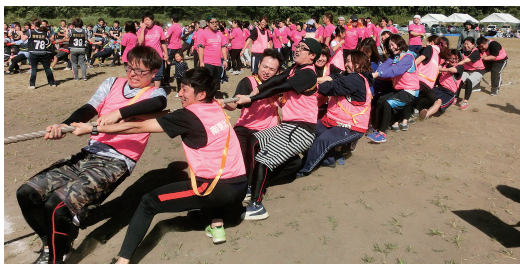
挑む福島チーム 力を合わせ綱引きに

南東北グループ恒例の大運動会が10月7日(日)、郡山市西田町の南東北グラウンドで開かれ、南東北福島からは総勢40人が参加しました。台風の影響が心配されましたが、快晴となり、選手らは昨年の悔しさを胸に競技に挑みました。綱引きと男女混合リレーは大接戦の末、惜しくも入賞を逃しました。それでも交流は深まり、全員で楽しむことができました。来年こそは各種目入賞を目指します。(南東北福島病院 親睦会担当)