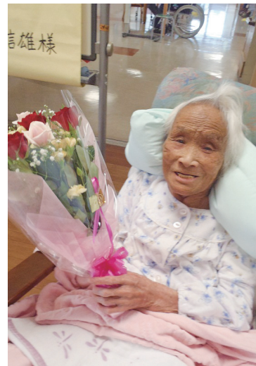
花束をプレゼントされ笑顔を見せる利用者さん

「敬老の日」の翌日の9月18日(火)、リハビリ南東北福島で敬老会が開かれました。