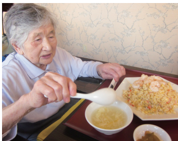
いつもとは違う雰囲気でお食事を楽しむ利用者さん

自分注目の注文した料理を「おいしいから食べてみて」と勧める姿も見られ、皆で少しずつ食べ比べをして楽しめました。お店の方にも親切に対応