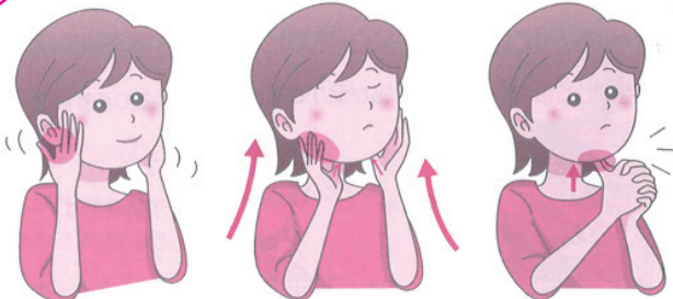
①耳下腺(じかせん) 指全体で耳の前、上の奥歯のあたりを後ろから前に円を書く。 ②顎下腺(あつかせん) 親指を顎(あご)の骨の内側の柔らかい部分に当て、耳の下から顎の下までを順番に押す。 ③舌下腺(ぜっかせん) 両手の親指をそろえて、顎(あご)の下から軽く押す。

年齢とともに唾液の分泌量は低下していくため、より乾燥がひどくなることもあります。唾液の量が減ることにも問題ですが、ほかに別の疾患が隠れている可能性も考えられますので、症状を感じたら一度診察を受けることをお勧めします。(歯科口腔外科 歯科衛生士 渡辺美由紀)