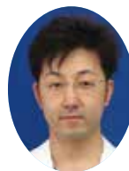
歯科口腔外科 医長