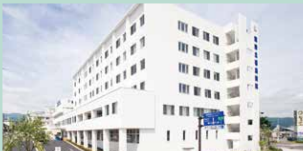
【院是】すべては患者さん・利用者さんのために